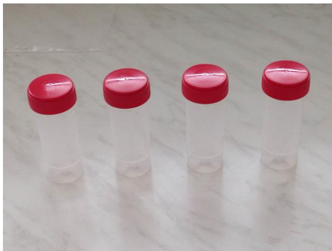
Obr 3: Vzorkovnice.

Zmesné vzorky po odbere odovzdajú chovatelia na regionálnej veterinárnej a potravinovej správe. Táto zabezpečí vypísanie sprievodného dokladu a odošle vzorky do národného referenčného laboratória v Dolnom Kubíne alebo veterinárnych a potravinových ústavov Bratislava a Košice.