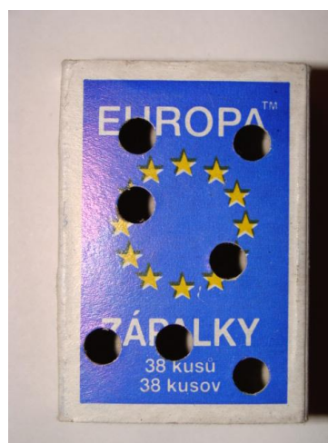
Obr.2: Dierkovačom perforovaná krabička zabezpečuje, aby vzorka neporástla plesňami. Pred predierkovaním vrchnáka vyberte vysúvaciu časť, aby ostala neporušená.

Ak je vzorka príliš vlhká, je možné ju nechať v otvorenej škatuľke čiastočne presušiť pri izbovej teplote počas 12-24 hodín. Vzorky nesušte na radiátore !!!! Pri balení vzoriek pred odoslaním používajte len priedušné materiály (papier, papierové krabice). Nevkladajte vzorky do igelitových vreciek a obalov , nakoľko takto zabalené vzorky plesnivujú a skresľujú výsledky získané z Vašich vzoriek !!! Vzorky balené do nepriedušných igelitových obalov nebudú vyšetrené.