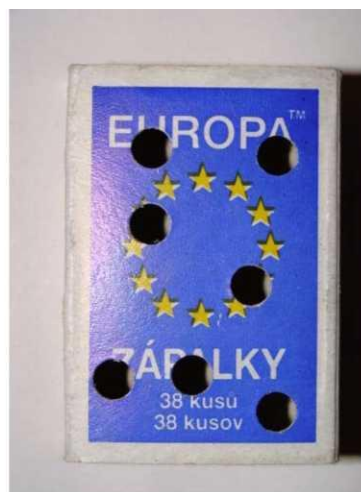
Obr.2: Dierkovačom perforovaná krabička zabezpečuje, aby vzorka neporástla plesňami. Pred predierkovaním vrchnáka vyberte vysúvaciu časť, aby ostala neporušená.